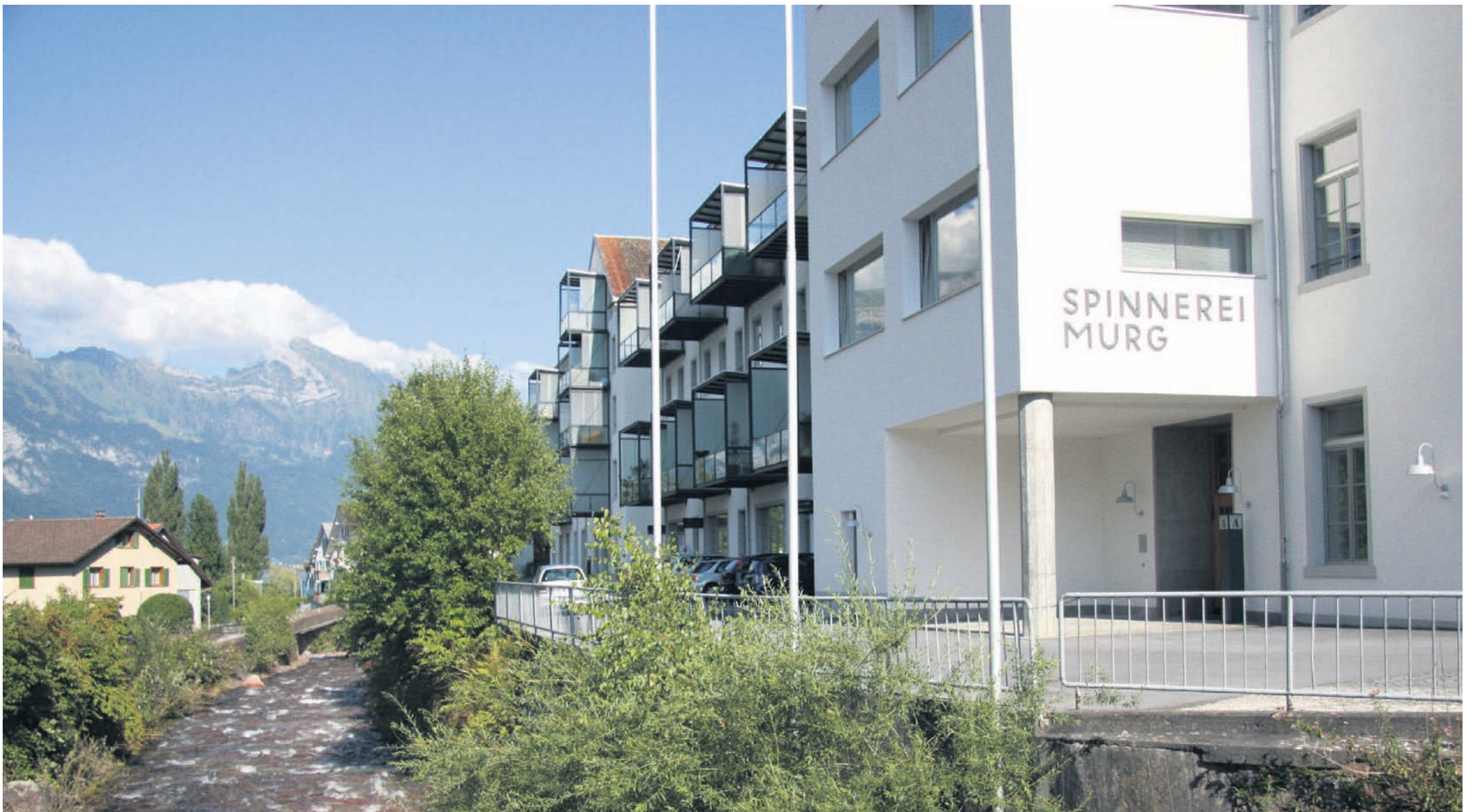
Bild der alten Spinnerei, Los 1 und 2.