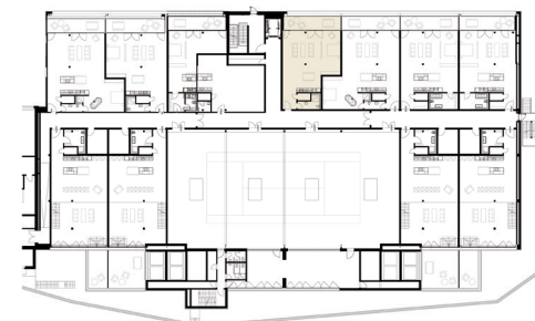
Grundriss Level 5